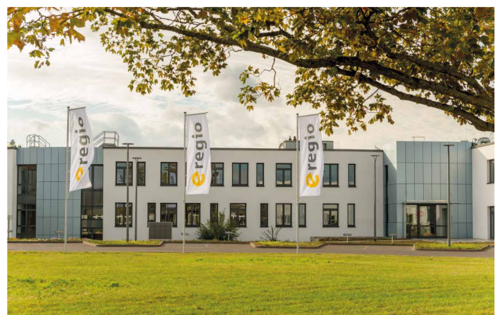
Hauptsitz der e-regio in Euskirchen

250 der 400 Beschäftigten bei e-regio arbeiten mit der Projektmanagementsoftware und hielten in ihr alle für die Fusion relevanten Sachverhalte an zentraler Stelle fest. Sie lassen sich dort auch mit Themen aus unter Umständen ganz anderen