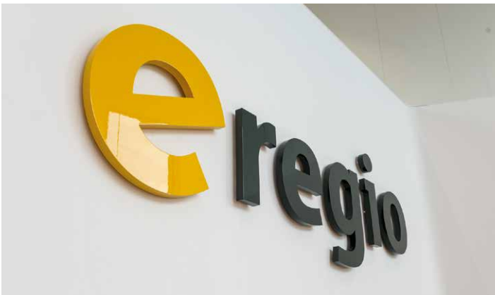
Im Teamwork mit Spezialisten auf dem Weg in die Digitalisierung

Ein Mausklick, und der Stromanbieter ist gewechselt. Die Digitalisierung hat das Verhalten der Kunden von Energieversorgern flüdr gemacht. Mit genau den gleichen Instrumenten können die Unternehmen darauf jedoch reagieren. Digitale Lösungen helfen dabei, Geschäftsprozesse zu beschleunigen, webbasierte Kontaktaufnahmemöglichkeiten zu schaffen, Abrechnungsprozesse zu vereinfachen und somit insgesamt einen besseren Service zu bieten. Die e-regio GmbH & Co. KG, regionaler Energiedienstleister aus Euskirchen, lässt sich dabei umfangreich von der TIMETOACT GROUP als Partner für die Digitalisierung beraten, sowohl technisch wie fachlich.